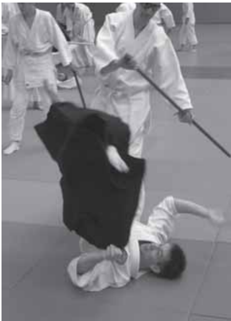
Wer angreift, sollte fallen können