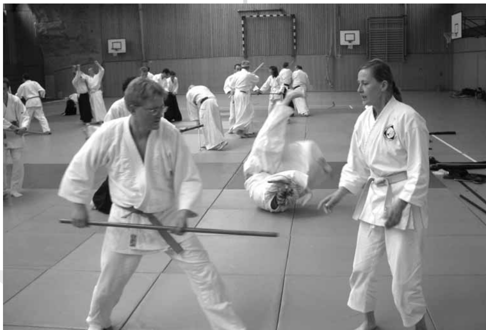
Konzentration vor der Aktion

Interessant war auch das Training mit Waffen. Der Einsatz des Jo-Stabes (knapp 130 cm lang) stellt hohe Ansprüche an das Koordinationsvermögen. Bei Anwendung des Stabes als Angriffs- und Verteidigungswaffe offenbaren sich schnell einmal Fehler, die beim waffenlosen Training kaum auffal-