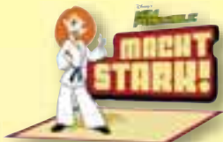
AKTION KIM POSSIBLE